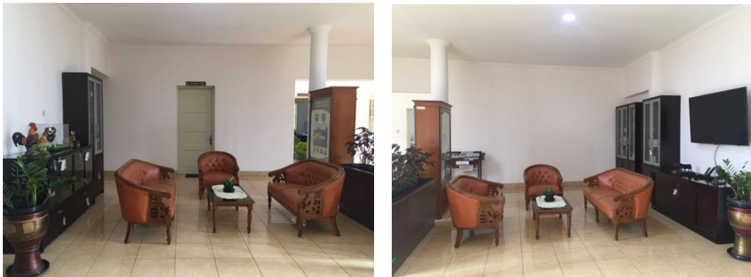
Gambar 10. Ruang Tunggu Publik