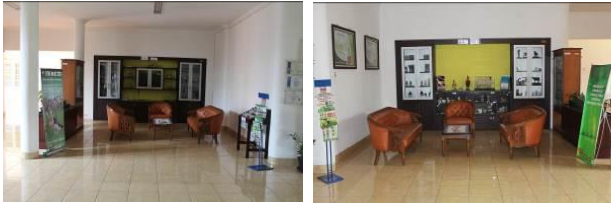
Gambar 6. Tempat Pelayanan Publik Puslitbangnak

Sejak tahun 2015 Puslitbangnak sudah menyusun standar pelayanan Publik (SPP) berdasarkan Surat Keputusan Kepala Puslitbangnak No.35.1/OT.050/I.5/02/ 2015 tentang Pembentukan Tim Penyusun Standar Pelayanan Publik pada Pusat Penelitian dan Pengembangan Peternakan.