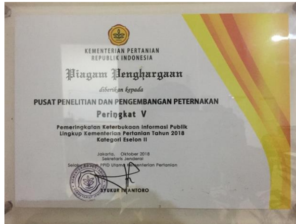
Gambar 20. Piagam Penghargaan Keterbukaan Informasi Publik Puslitbangnak TA 2018