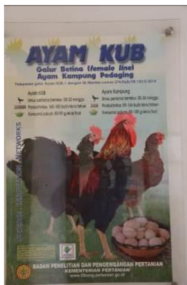
Gambar 11. Informasi Layanan Publik (Poster 1) Ayam KUB