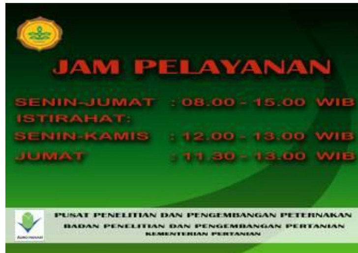
Gambar 8. Ketentuan jam pelayanan UPP