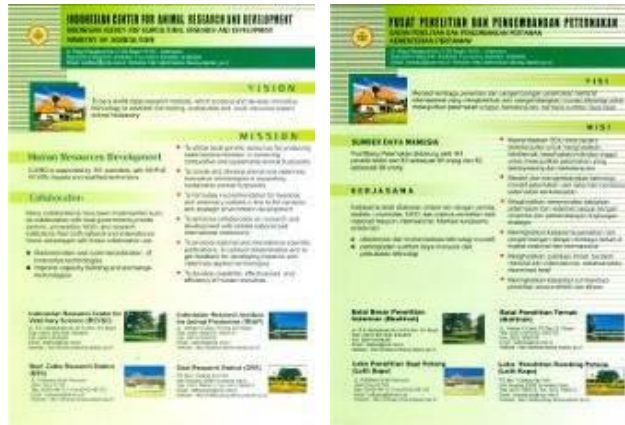
Gambar 5. Leaflet Profil Puslitbangnak