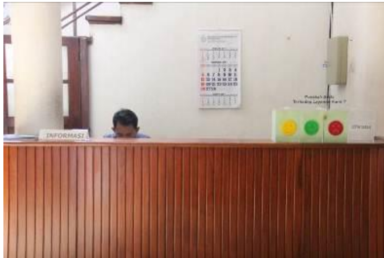
Gambar 9. Counter Desk Informasi Layanan Publik