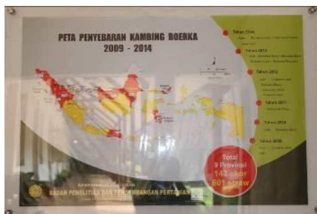
Gambar 18. Informasi Layanan Publik (Poster 8)

KEBIJAKAN MUTU PUSAT PENELITIAN DAN PENGEMBANGAN PETERNAKAN KEBERYAKTIAN PERUMAH • PENELITIAN AKAN dilakukan secara terpadu dan sistematis yang mencakup aspek produksi, kesehatan, kesejahteraan, lingkungan, dan ekonomi, serta aspek lain yang berpengaruh terhadap keberhasilan. • PENGEMBANGAN dilakukan secara sistematis, terpadu, dan terintegrasi dengan aspek produksi, kesehatan, kesejahteraan, lingkungan, dan ekonomi, serta aspek lain yang berpengaruh terhadap keberhasilan. • PENYEBARAN dilakukan secara sistematis, terpadu, dan terintegrasi dengan aspek produksi, kesehatan, kesejahteraan, lingkungan, dan ekonomi, serta aspek lain yang berpengaruh terhadap keberhasilan. • PUSAT PENELITIAN DAN PENGEMBANGAN merupakan lembaga penelitian dan pengembangan yang menyelenggarakan penelitian dan pengembangan yang terpadu dan terintegrasi. Badan Penelitian dan Pengembangan Pertanian Pusat Penelitian dan Pengembangan Peternakan Kebek, Bogor, Jawa Barat