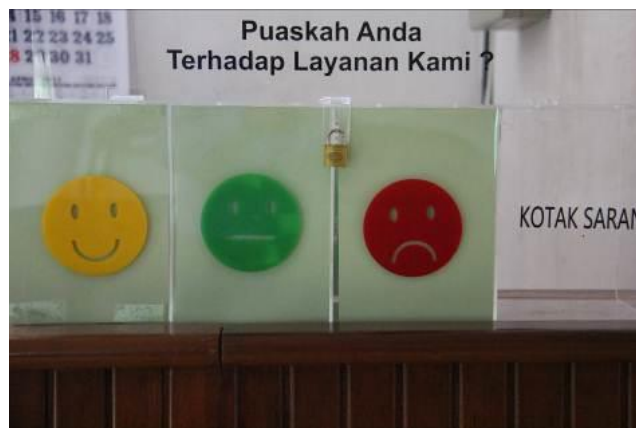
Gambar 27. Kotak Saran/Pengaduan Pelayanan Publik