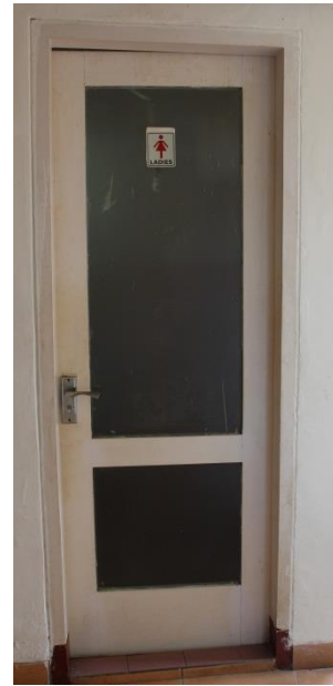
Gambar 25. Toilet/ WC Layanan Publik