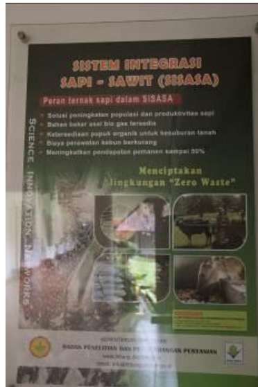
Gambar 14. Informasi Layanan Publik (Poster 4) SISASA