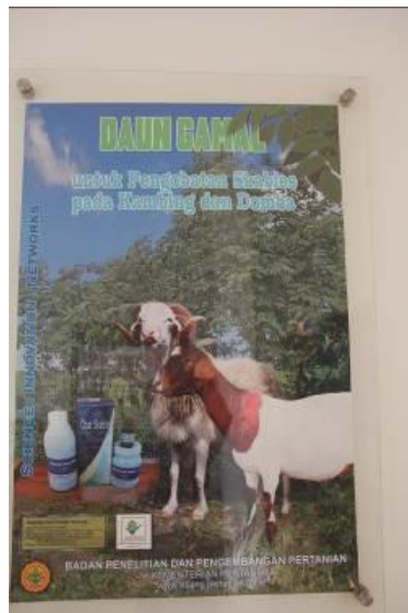
Gambar 13. Informasi Layanan Publik (Poster 3) Daun Gamal