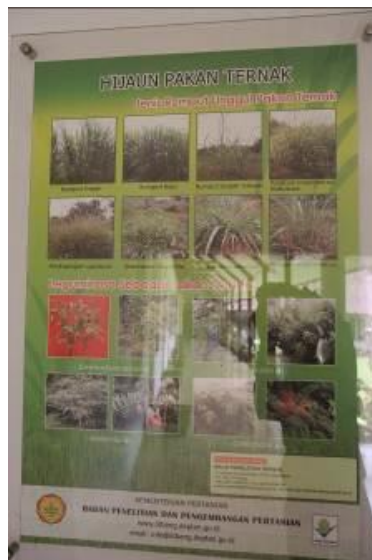
Gambar 15. Informasi Layanan Publik (Poster 5) Hijauan Pakan Ternak