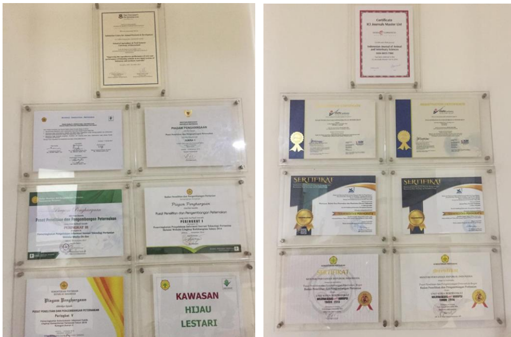
Gambar 21. Sertifikat dan Penghargaan yang Telah diraih Puslitbangnak