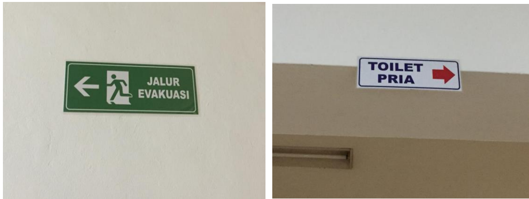
Gambar 27. Penunjuk Arah Pelayanan Publik