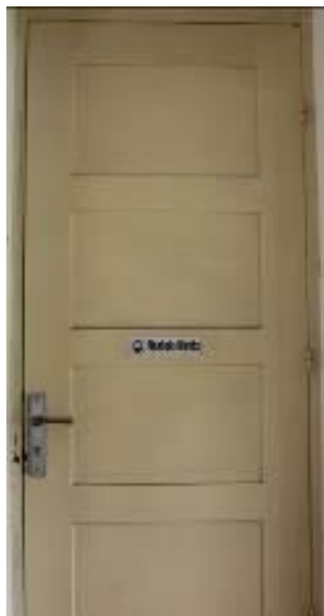
Gambar 26. Tempat Shalat Wanita