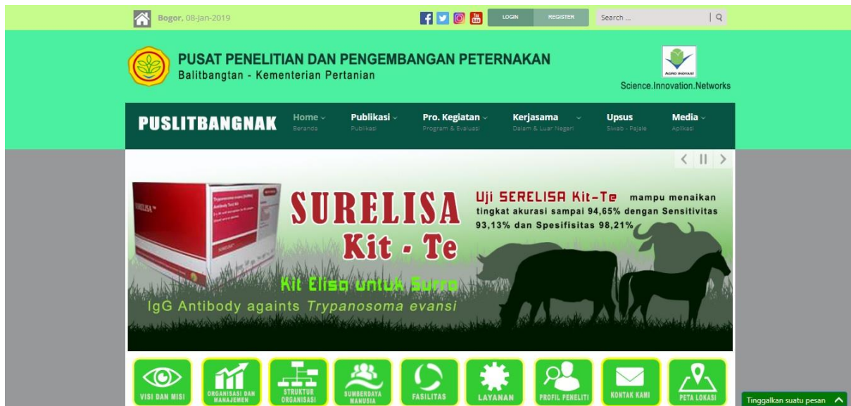
Gambar 22. Layanan Publik Secara Elektronik