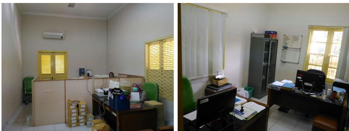
Gambar 24. Ruang Pustakawan dan Ruang Sekretariat Jurnal Ilmiah Perpustakaan