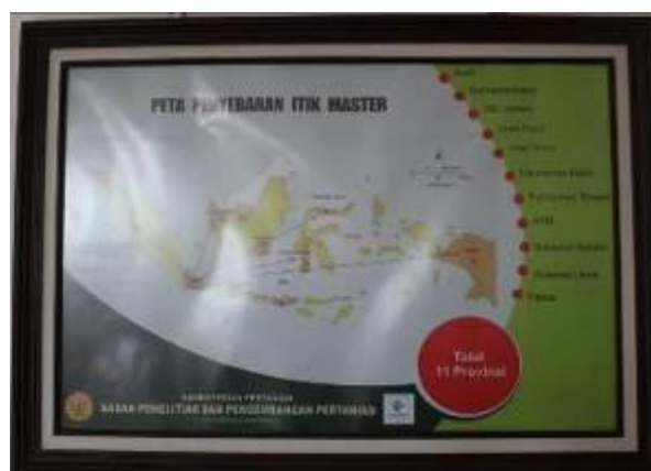
Gambar 16. Informasi Layanan Publik (Poster 6)