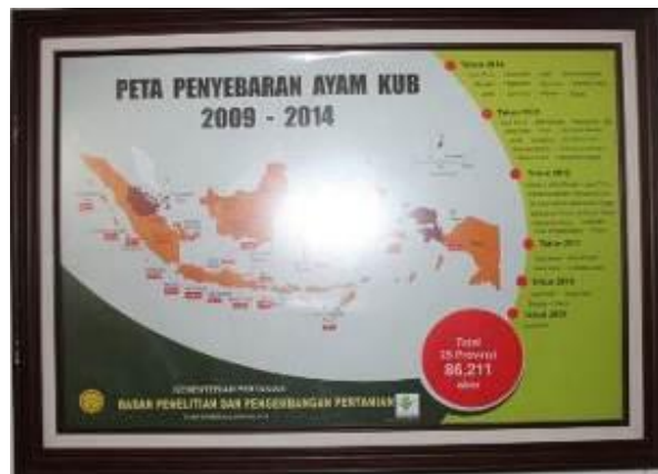
Gambar 17. Informasi Layanan Publik (Poster 7)