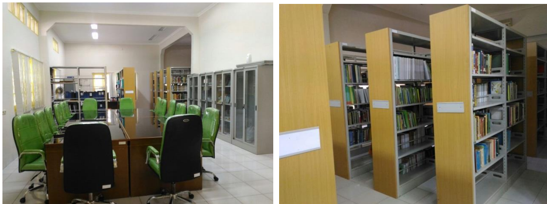
Gambar 23. Ruang baca di Perpustakaan